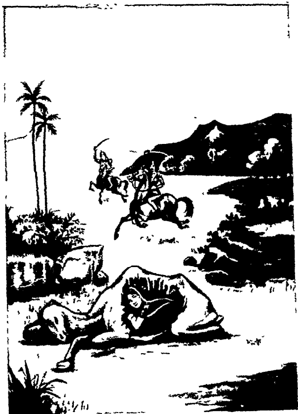
उंटके पेटमें करमैतीवाई